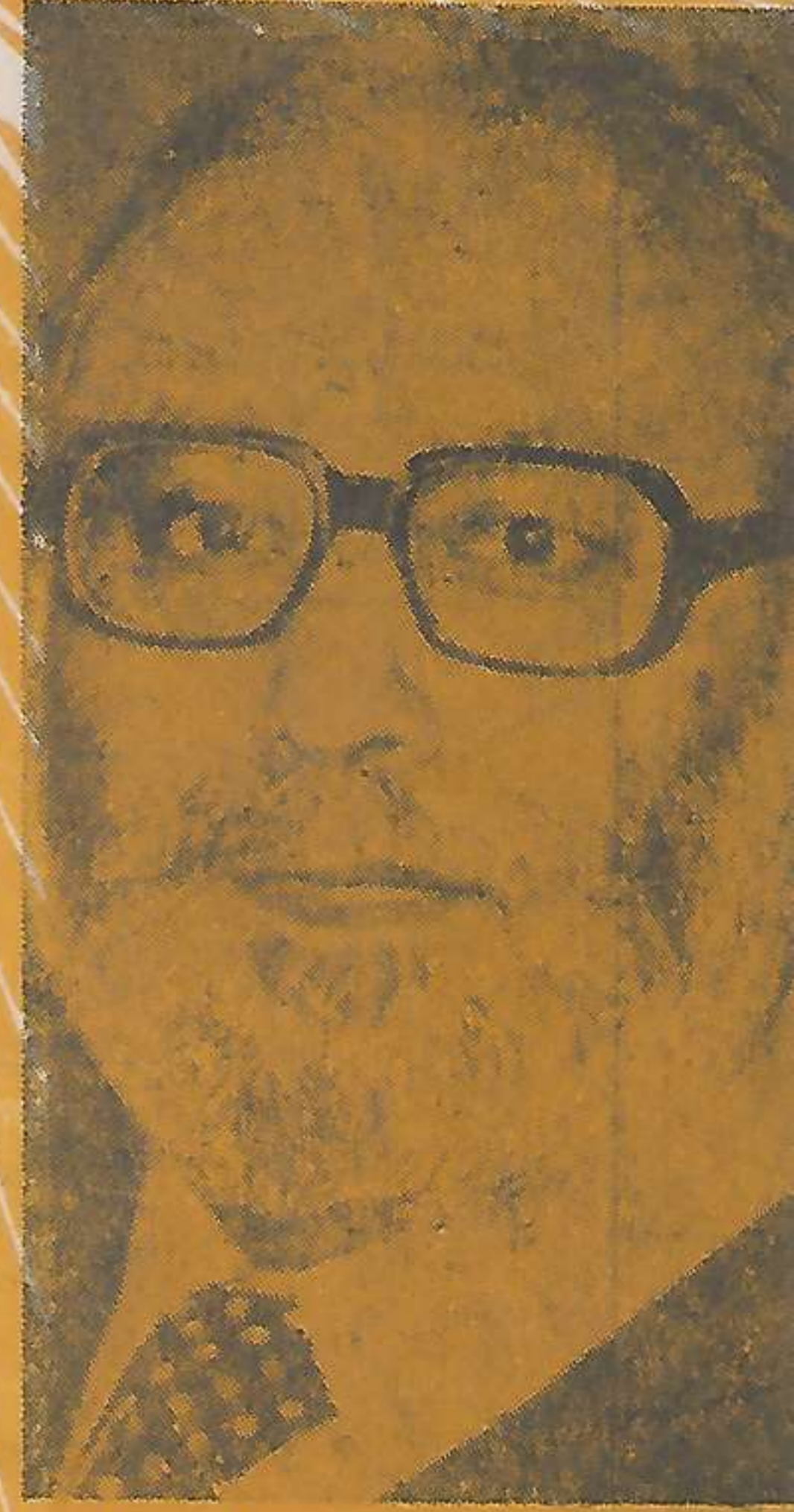
ನೋಬೆಲ್ ಪ್ರಶಸ್ತಿ ವಿಜೇತ ಪ್ರೊ. ಸಲಾಂ

ತ್ರೆಮಾ ಸಿ ಕೆ ಡಿಸೆಂಬರ್ 1979 ಫತಹ್ 1358 ಬೆಲೆ: ರೂ. 1-00