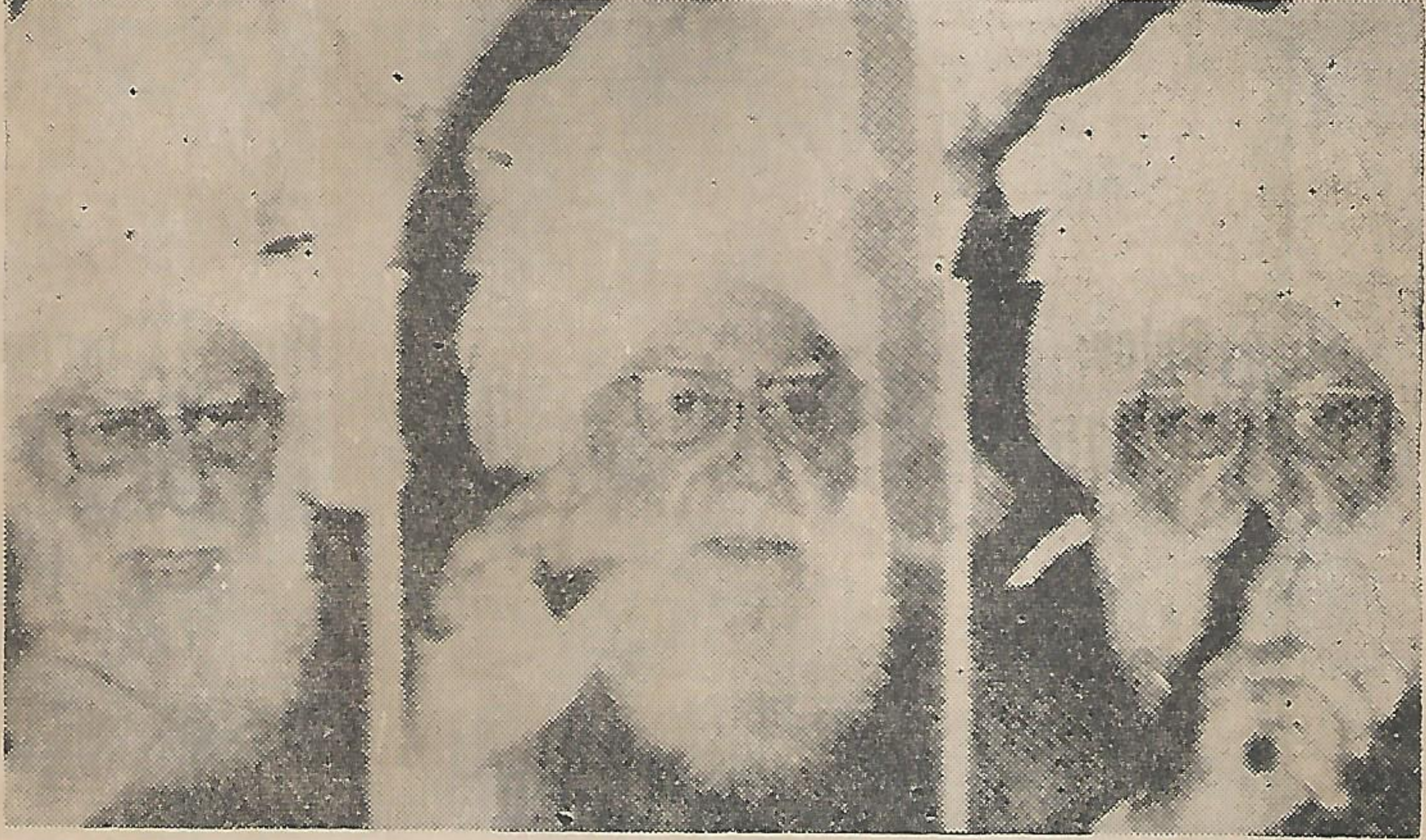
Khalifatul Mashi III, the Supreme Head of the Ahmadiyya Movement in Islam, at his London press conference yesterday in which he announced the first stage of the conversion of Europe to Islam, including the translation of the Holy Quran into 100 languages.

ಅಹ್ಮದಿಯಾ ಖಲೀಫರವರು ಆಗಸ್ಟ್ 14ರಂದು ಲಂಡನಿನಲ್ಲಿ ನಡೆದ ಪತ್ರಿಕಾಗೋಷ್ಠಿಯಲ್ಲಿ ಮಾತನಾಡುತ್ತಿದ್ದಾರೆ. ಯುರೋಪಿನಲ್ಲಿ ಇಸ್ಲಾಮಿನ ಪ್ರಚಾರ ಮತ್ತು 100 ಭಾಷೆಗಳಲ್ಲಿ ಖುರಾನ್‌ನನ್ನು ಭಾಷಾಂತರಿಸುವ ಅಹ್ಮದಿಯಾ ಸಂಘಟನೆಯ ಕಾರ್ಯಕ್ರಮದ ಕುರಿತು ಸಹ ಅವರು ಪ್ರಸ್ತಾಪಿಸಿದರು. ಈ ಗೋಷ್ಠಿಯಲ್ಲಿ 60 ಪತ್ರಿಕಾ ಪ್ರತಿನಿಧಿಗಳು ಭಾಗವಹಿಸಿದ್ದರು.