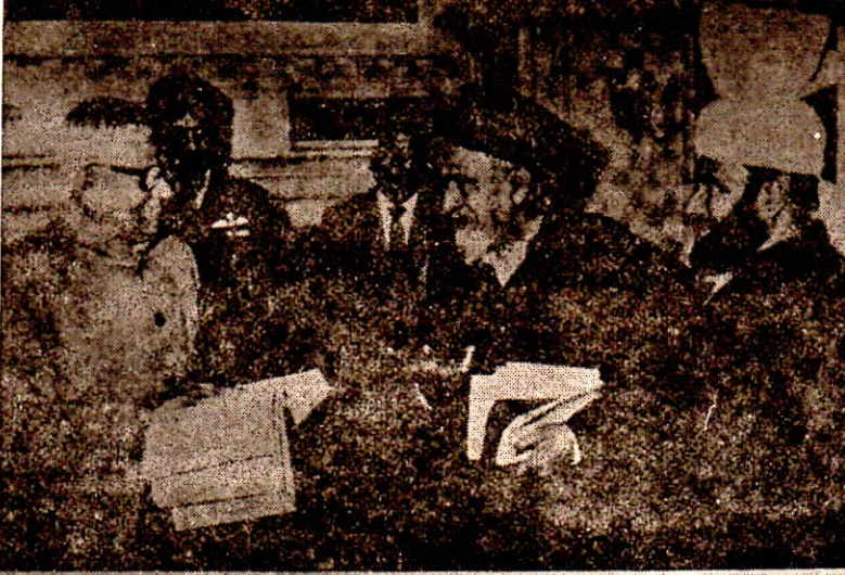
A delegation of Muslim leaders presented a copy of the Hindi version of Holy Quran to the President, R. Venkataraman in New Delhi on February 18

ರಾಷ್ಟ್ರಪತಿಯವರಿಗೆ ಖುರ್ಆನ್ ಹಿಂದಿ ಭಾಷಾಂತರದ ಉಡುಗೊರೆ