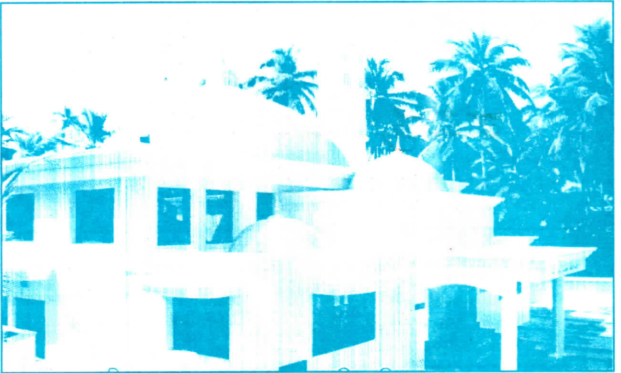
ಕನ್ನೂರು ಜಿಲ್ಲೆಯ ಪಯಂಗಾಡಿಯಲ್ಲಿರುವ ಅಹ್ಮದಿಯಾ ಮುಸ್ಲಿಂ ಮಸೀದಿ "ತಾಹಿರ್ ಮಸಜಿದ್". (ವರದಿ 43ನೇ ಪುಟದಲ್ಲಿ)