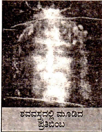
ಶವವಸ್ತ್ರದಲ್ಲಿ ಮೂಡಿದ ಪ್ರತಿಬಿಂಬ

1988ರಲ್ಲಿ ಶವವಸ್ತ್ರದ ಬಗ್ಗೆ ಅಂತರರಾಷ್ಟ್ರೀಯ ಪತ್ರಿಕೆಗಳಲ್ಲಿ ಮುಖ್ಯ ಸಮಾಚಾರಗಳು ಪ್ರಕಟವಾದವು. ಕಾರ್ಬನ್-14 ಪರೀಕ್ಷೆ ಮೂಲಕ ಈ ಶವವಸ್ತ್ರ 1260 ರಿಂದ 1360 ಕಾಲಾವಧಿಯಲ್ಲಿ ನಿರ್ಮಿತವಾದುದೆಂದು ಸಾಬೀತಾಗಿದೆ ಎಂದು ಪ್ರಕಟವಾಯಿತು. ಈ ವಸ್ತ್ರ ಕೃತ್ರಿಮವೋ ವಾಸ್ತವಿಕವೋ ಎಂಬುದರ ಬಗ್ಗೆ ನಾಲ್ಕು ಪ್ರಯೋಗ ಶಾಲೆಗಳು ಸ್ವತಂತ್ರವಾಗಿ ಪ್ರಯೋಗ ನಡೆಸಿ ಈ ತೀರ್ಮಾನಕ್ಕೆ ಬಂದಿದ್ದವು.