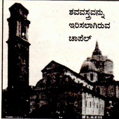
ಶವವಸ್ತ್ರವನ್ನು ಇರಿಸಲಾಗಿರುವ ಚಾಪೆಲ್

ಕೆಲವರು ಹೇಳುವುದು ಬೈಬಲಿನಲ್ಲಿ ಪ್ರಸ್ತಾಪಿಸಲಾದ ಶವವಸ್ತ್ರವೇ ಟ್ಯೂರಿನ್‌ನಲ್ಲಿರುವ ಶವವಸ್ತ್ರವಾಗಿದೆ ಎಂದು. ಬೇರೆ ಕೆಲವು ವಾದಗಳು ಇಂತಹ ಅವಶೇಷಗಳ ಬಗ್ಗೆ ಇದ್ದರೂ ಟ್ಯೂರಿನಿನ ಶವವಸ್ತ್ರ ಅತ್ಯಂತ ಆಕರ್ಷಕವೂ ಅತ್ಯಂತ ಸರಿಯಾದುದೆಂದೂ ಅಂಗೀಕರಿಸಲ್ಪಟ್ಟಿದೆ. 1898ರಲ್ಲಿ ಈ ಶವವಸ್ತ್ರದ ಪ್ರಥಮ ಫೋಟೋಗ್ರಾಫನ್ನು ಸೆಕೊಂಡೋ ಪಯಾ ಎಂಬವನು ಮೊದಲ ಬಾರಿಗೆ ತೆಗೆದಾಗ ಈ ಶವವಸ್ತ್ರದ ಅಂತಸ್ತು ಅಂಗೀಕರಿಸಲ್ಪಟ್ಟಿತು.