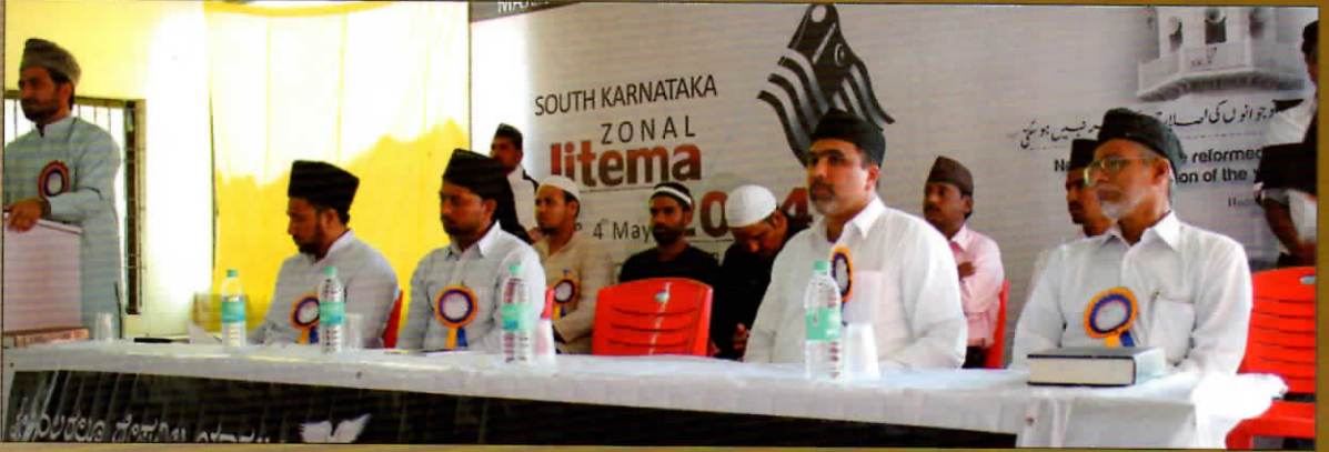
ಮೇ 3 ಮತ್ತು 4ರಂದು ಮಂಗಳೂರು ಎನ್‌ಜಿಒ ಹಾಲ್‌ನಲ್ಲಿ ಜರುಗಿದ ಮುದ್ದಾಘುಲ್ ಅಹ್ಮದಿಯಾ, ಅತ್ಘಾಲುಲ್ ಅಹ್ಮದಿಯಾ ಇಜ್ತಿಮಾ.