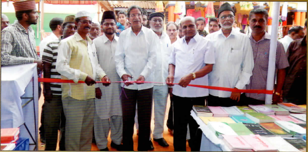
ಫೆಬ್ರವರಿ 18ರಂದು ಸಾಗರದಲ್ಲಿ ಅಹ್ಮದಿಯಾ ಪುಸ್ತಕ ಮಳಿಗೆಯನ್ನು ಸಾಹಿತಿ ಡಾ. ನಾ. ಡಿ'ಸೋಜ ಉದ್ಘಾಟಿಸಿದರು.