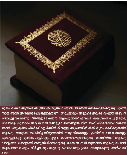
യുദ്ധം ചെയ്യപ്പെടുന്നവർക്ക് (തിരിച്ചും യുദ്ധം ചെയ്യാൻ) അനുമതി നൽകപ്പെട്ടിട്ടില്ലെന്നും, എന്തെന്നാൽ അവർ അക്രമിക്കപ്പെട്ടിട്ടില്ലാത്തവരാണ്. തിരിച്ചുയരും അല്ലാഹു അവരെ സഹായിക്കുവാനായി കഴിവുള്ളവനാകുന്നു. "അങ്ങളുടെ നാഥൻ അല്ലാഹുവാണ്" എന്നവർ പറയുന്നതാഴിച്ച് (അല്ലാഹു കാണലും കൂടാതെ) അനുമതിയിൽ തങ്ങളുടെ ദേഹങ്ങളിൽ നിന്ന് ബഹിഷ്കരിക്കപ്പെട്ടവരാണ് അവർ. മനുഷ്യരിൽ ചിലർക്ക് മറ്റുചിലരിൽ നിന്നുള്ള അക്രമത്തിൽ നിന്ന് സ്വയം രക്ഷിക്കുന്നതിന് അല്ലാഹു അനുമതി നൽകിയില്ലാത്തവരേക്കാൾ സന്യാസികളെയും ക്രിസ്തീയ ദേവദൂതങ്ങളെയും മറ്റും പറ്റിയിട്ടുണ്ട്. എല്ലാ അക്രമിക്കപ്പെട്ടവർക്കും, അവരിൽനിന്ന് അല്ലാഹു വിന്റെ നാമം ധാരാളമായി അനുനിമിക്കപ്പെടുന്നു. അന്നേ സഹായിക്കുന്നവരെ അല്ലാഹു സഹായിക്കുക അന്നേ ചെയ്യും. തിരിച്ചുയരും അല്ലാഹു മഹാകരന്മാരും പ്രവാചകന്മാരും (അൽഹബ്ബ് 40:41)

ജീവിതം അതിന് സാക്ഷിയാണ്. അവിടുത്തെ ആദ്യകാല ജീവിതം പരിശോധിച്ചാലറിയാം പ്രവാചകതത്തിന്റെ ആദ്യകാലങ്ങളിൽ തന്റെ ജന്മനഗരമായ മക്കയിൽ ഇസ്ലാമിന്റെ സ്നേഹത്തിന്റെയും സൗഹാർദത്തിന്റെയും സന്ദേശം മാത്രമാണ് എപ്പോഴും പ്രചരിപ്പിക്കാൻ ശ്രമിച്ചിരുന്നത്. എങ്കിലും മക്കക്കാർ അദ്ദേഹത്തെ നിരാകരിച്ചു എന്ന് മാത്രമല്ല റസൂൽ തിരുമേനി(സ)യോട് അവർ അങ്ങേയറ്റം ക്രൂരവും നിർദ്ദയവുമായ രീതിയിലുമാണ് പെരുമാറിയത്. അവിടുന്നും അവിടുത്തെ അനുചരന്മാരും അതിക്രൂരമായി മർദ്ദിക്കപ്പെട്ടു. അങ്ങനെ അവസാനം ദൈവത്തിന്റെ അറിയിപ്പിനാൽ റസൂൽ തിരുമേനി(സ) മക്കയിൽനിന്നും പലായനം ചെയ്ത് മദീന