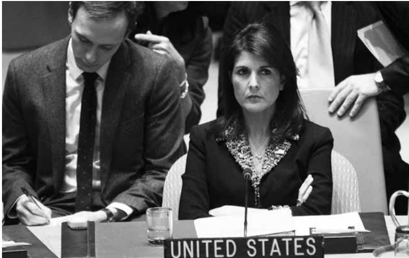
അമേരിക്കൻ അംബാസിഡർ നിക്കി ഹാലി

കഴിഞ്ഞ കുറെ വർഷങ്ങളായി മുസ്ലിം രാജ്യങ്ങൾ പരസ്പരം ഘോരമായ യുദ്ധങ്ങളും കക്ഷിതീരിഞ്ഞുള്ള ആഭ്യന്തര കലാപങ്ങളും വിപ്ലവങ്ങളും നടത്തി ശക്തികുടിയായി സ്വയം ദുർബലമായിരിക്കുകയാണ്. മുസ്ലിം സമൂഹത്തിന്റെ കൊള്ളരുതായ്മകളും അധഃപതനവുമാണ് ഇതിന് മുഖ്യ കാരണം. കൂടാതെ സാമ്രാജ്യത്വ ശക്തികളും സിയോണിസ്റ്റുകളും മുസ്ലിം ദുർബലങ്ങളെ ഏതവസരത്തിലും ചൂഷണം ചെയ്യാൻ കഴുകുണ്ണുകളുമായി ചുറ്റും നിൽക്കുകയും ചെയ്യുന്നു. ഇറാഖും ഇറാനുമായി 1980 മുതൽ 1988 വരെ നടത്തിയ ഘോരയുദ്ധം, ഇറാഖ് കувൈത്തിനെ ആക്രമിച്ചു എന്ന് പറഞ്ഞ് ഇറാഖിനെതിരെ മുഴുവൻ