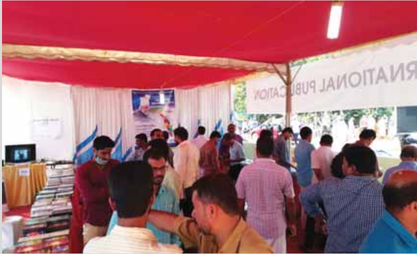
മലപ്പുറം ജില്ലയിലെ കുരിയാട് 2017 ഡിസംബർ 28 മുതൽ 31 വരെ നടന്ന മുജാഹിദ് സംസ്ഥാന സമ്മേളനത്തോടനുബന്ധിച്ച് അഹ്മദിയ്യാ മുസ്ലിം ജമാഅത്ത് നടത്തിയ പുസ്തക പ്രദർശനവും വില്പനയും