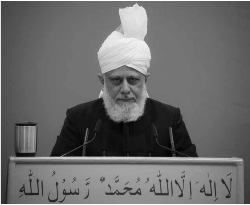
ഹദ്റത്ത് മിർസാ മസ്റൂർ അഹ്മദ് (അയ്യൂബു...)

അമീറുൽ മുഅ്മിനിൻ ഖലീഫത്തുൽമസീദ് ഹദ്റത്ത് മിർസാ മസ്റൂർ അഹ്മദ് (അയ്യൂബു...) 2017 ഡിസംബർ 1ന് ബൈത്തുൽ ഫുതുഹ്, ലണ്ടനിൽ നിർവഹിച്ച ജുമുഅ ഖുത്ബയുടെ സംഗ്രഹം. വിവ. മുഹമ്മദ് ഇസ്മായിൽ, ആലപ്പി.