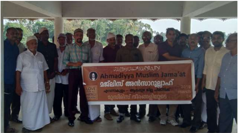
മജ്ലിസ് അൻസാറുല്ലാഹ് എറണാകുളം - ആലപ്പുഴ ജില്ല ആഭിമുഖ്യത്തിൽ മുസ്ലിം തീരങ്ങളിലൂടെ പൈതൃക യാത്ര നടത്തി.

വിശുദ്ധ ഖുർആനിൽ പേരെടുത്ത് പറഞ്ഞതും അല്ലാത്തതുമായ പ്രവാചകന്മാരുടെ സുസ്ഥാപിതമായ പെരുമാറ്റ സമ്പ്രദായത്തിന് വിരുദ്ധമായി മൗലാനാ മൗദുദി ദൈവത്തിന്റെ അടയാറുകളെ നിർബന്ധിക്കാനും മർദ്ദിക്കുവാനുമുള്ള അധികാരം സ്വയം കൈയേൽക്കുകയും ചെയ്യുന്നു. അങ്ങനെ ജമാഅത്തെ ഇസ്ലാമി അനീതിയും അരാജകത്വവും തിന്മയും അനുസരണക്കേടും ഭൂമുഖത്ത് നിന്നും വിപാടനം ചെയ്യും പോലും.15 - ‘മതത്തിന്റെ പേരിൽ മനുഷ്യാഹത്യ’ (തുടരും)