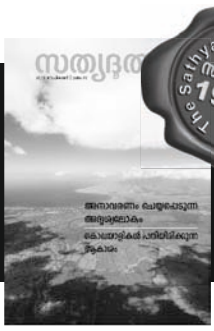
The Sathyadoothan Monthly