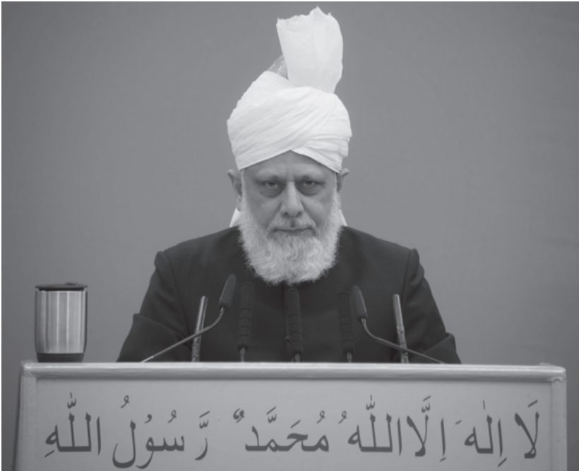
ഹദ്റത്ത് മിർസാ മസ്റൂർ അഹ്മദ് (അയ്യൂദഹു...)

ബദരീസഹാബാക്കളെ സംബന്ധിച്ച അനുസ്മരണത്തിൽ ഇന്ന് ഹദ്റത്ത് അബൂ ഉബയ്ദ ബിൻ ജർറാഹിനെ പറ്റിയാണ് വിവരിക്കുന്നത്. ഹദ്റത്ത് അബൂ ഉബയ്ദ ബിൻ ജർറാഹിന്റെ പേര് ആമിർ ബിൻ അബ്ദുല്ലാഹ് എന്നായിരുന്നു. അദ്ദേഹത്തിന്റെ പിതാവിന്റെ പേര് അബ്ദുല്ലാഹ് ബിൻ ജർറാഹ് എന്നാകുന്നു. ഹദ്റത്ത് അബൂ ഉബയ്ദ ബിൻ ജർറാഹ് തന്റെ വിളിപ്പേര്