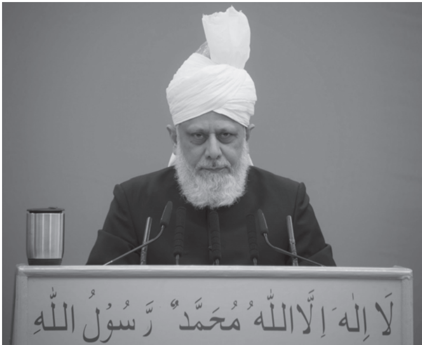
ഹദ്റത്ത് മിർസാ മസ്റൂർ അഹ്മദ് (അയ്യൂദ്ധൂ...)

തഖ്വ അഥവാ ദൈവഭക്തിക്ക് സൽസഭാഭാവം നിർബന്ധമാണ്. മനുഷ്യൻ മുത്തവിയായിത്തീരുന്നത് അവനിൽ ഉത്തമമായ എല്ലാ സഭാവങ്ങളും ഉണ്ടാകുമ്പോഴാണ് ഹദ്റത്ത് മസീഹ് മൗഊദ് (അ) ഉപദേശിച്ചിട്ടുണ്ട്. അതിനാൽ എല്ലാ സഭാചാരഗുണങ്ങളും സ്വായത്തമാക്കാൻ മുഅ്മിൻ പരിശ്രമിക്കേണ്ടതാണ്. അപ്പോഴായിരിക്കും ഒരു