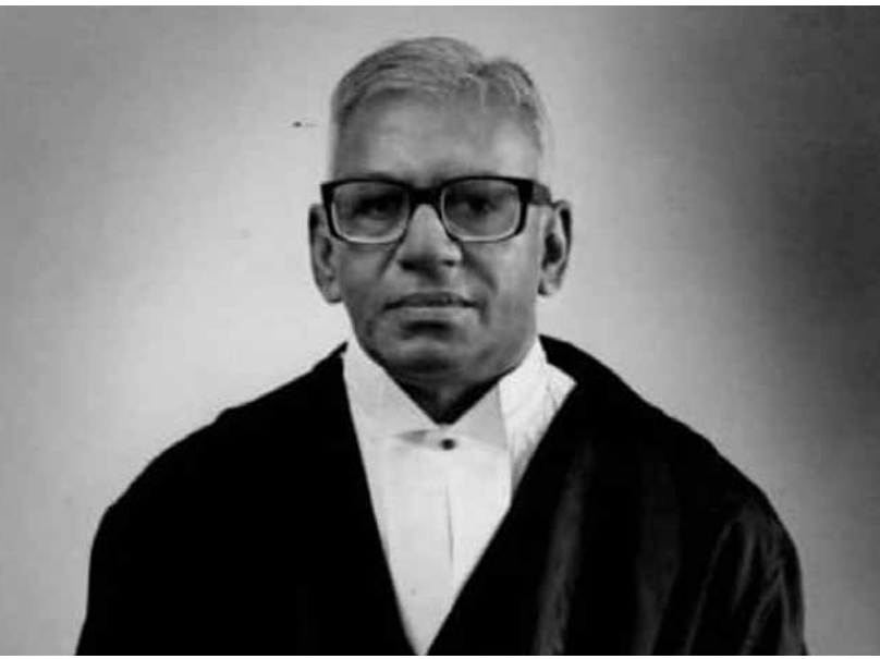
വി.ആർ കൃഷ്ണയ്യർ- ഒരു പഴയകാല ചിത്രം

ഉത്തരം: സാധിക്കും എന്നാണ് എന്റെ വിശ്വാസം. സാധിക്കുന്നില്ല എന്ന് പരമാർത്ഥം മറച്ച് വെച്ചത് കൊണ്ട് യാതൊരു കാര്യവുമില്ല. ഇന്ന് എന്താണ് നടക്കുന്നതെന്ന് വെച്ചാൽ ഈ രാജ്യത്ത് ബഹുമതങ്ങൾ ഉണ്ടെന്ന് എല്ലാവരും അംഗീകരിക്കുന്നു എന്നു മാത്രമല്ല സർ രാധാകൃഷ്ണൻ മഹാത്മാ ഗാന്ധി എന്നിവരെല്ലാം നമ്മെ പറഞ്ഞു ധരിപ്പിച്ചിട്ടുള്ള ഈ വീക്ഷണ കോണിൽ കൂടി നോക്കുകയാണെങ്കിൽ എല്ലാ മതങ്ങളിലും മാനുസ്യതയുണ്ട്. എല്ലാ മതങ്ങളിലും സത്യമുണ്ട് അതുകൊണ്ട് എല്ലാ മതാനുയായികളും സൗഹൃദത്തിൽ ജീവിക്കേണ്ട ഒരു രാജ്യമാണ് ഭാരതം. എങ്കിലും ഈ വർഗ്ഗീയതയെ പ്രീണിപ്പിക്കാൻ വേണ്ടി പല കക്ഷികളും ശ്രമിക്കുന്നതായി കാണാം വർഗ്ഗീയതയിൽ നിന്ന് രാഷ്ട്രീയമായി മുതലെടുക്കാൻ ശ്രമിക്കുന്ന ശക്തികളുമുണ്ട്. വർഗ്ഗീയതയേയും മതവികാരത്തേയും കുട്ടിക്കുഴച്ച് ഈ രാജ്യത്ത് കുഴപ്പങ്ങളും കഷ്ടപ്പാടുകളും സൃഷ്ടിക്കുന്ന ആ വിഭാഗം നിലനിൽക്കുമ്പോൾ എങ്ങനെയാണ് ഇത് അവസാനിപ്പിക്കുക? ഇന്ന് നാം ചെയ്യേണ്ടത് രാഷ്ട്രീയമൊ