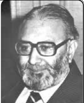
ഡോ. മൻമോഹൻ സിംഗ്.