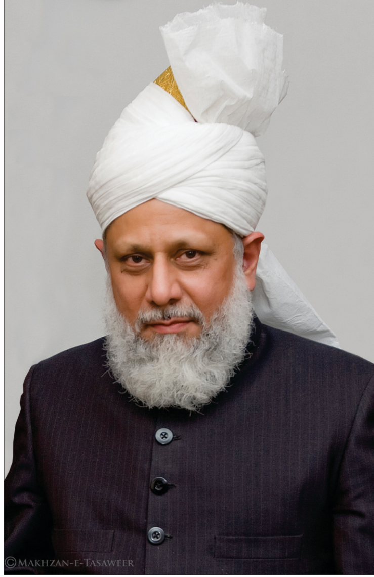
హజ్రత్ మీర్జా మసూద్ అహ్మద్ ఖలీఫతుల్ మసీదుల్ ఖామిస్ అయ్యుదహుల్లాహు తాలా బినసైహిల్ అజీజ్